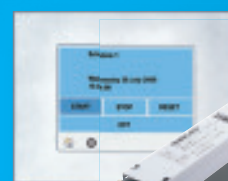
Lichtsteuersysteme für DALI Anwendungen